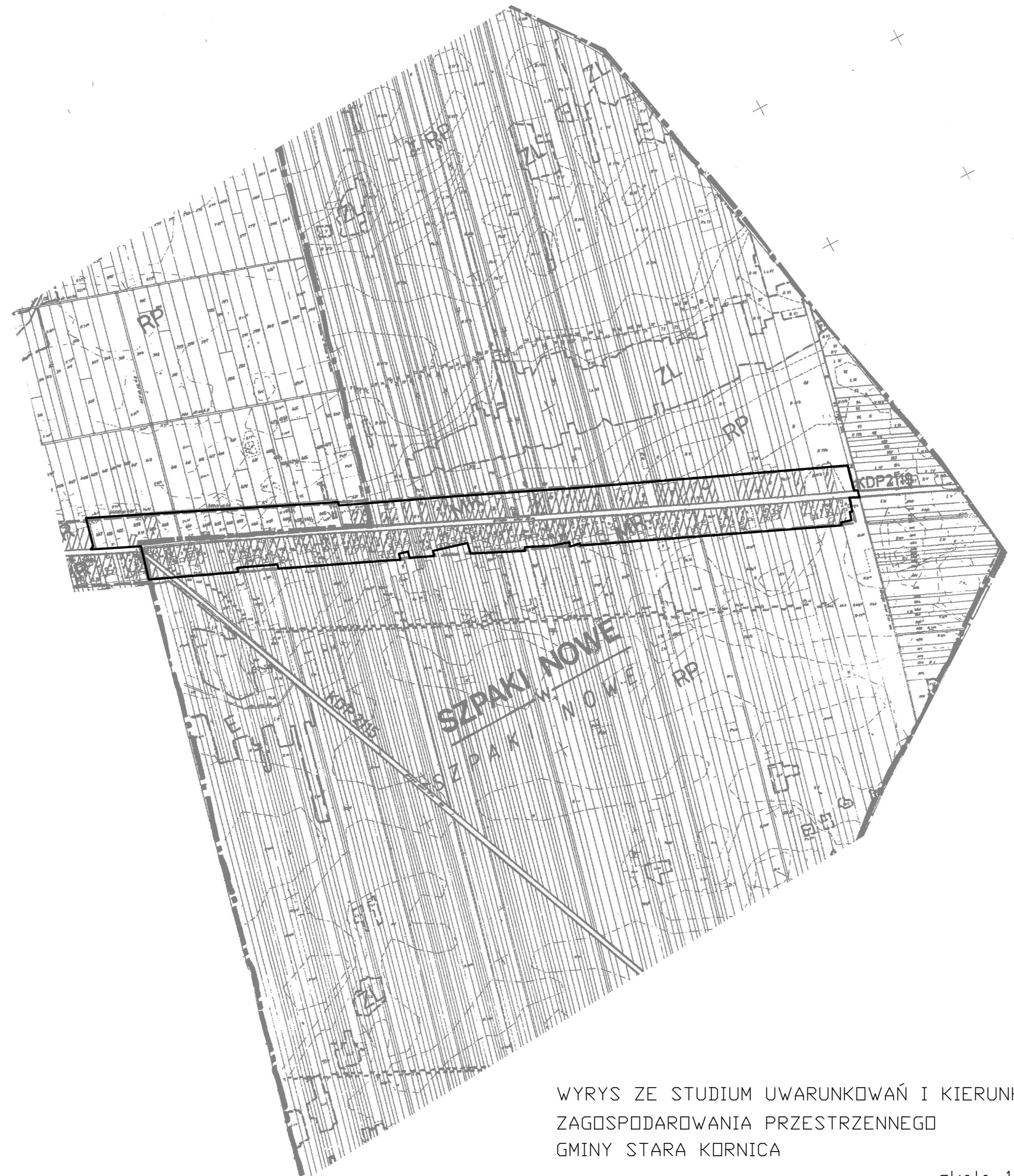
WYRYS ZE STUDIUM UWARUNKWAŃ I KIERUNKÓW ZAGOSPODAROWANIA PRZESTRZENNEGO GMINY STARA KORNICA skala 1:10000

Geodeta Wojciech G. ul. Armii Krajowej 100 62-000 Kalisz data: 25.02.05