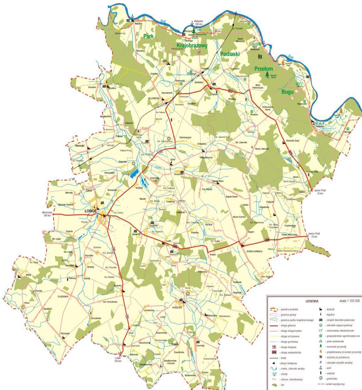
Rysunek 1- Lokalizacja gminy na tle powiatu łosickiego

Ważnym elementem usytuowania gminy jest bliskie sąsiedztwo ze wschodnią granicą Polski, z przejściem granicznym w Terespolu i Koroszczynie, w odległości ok. 40 km.