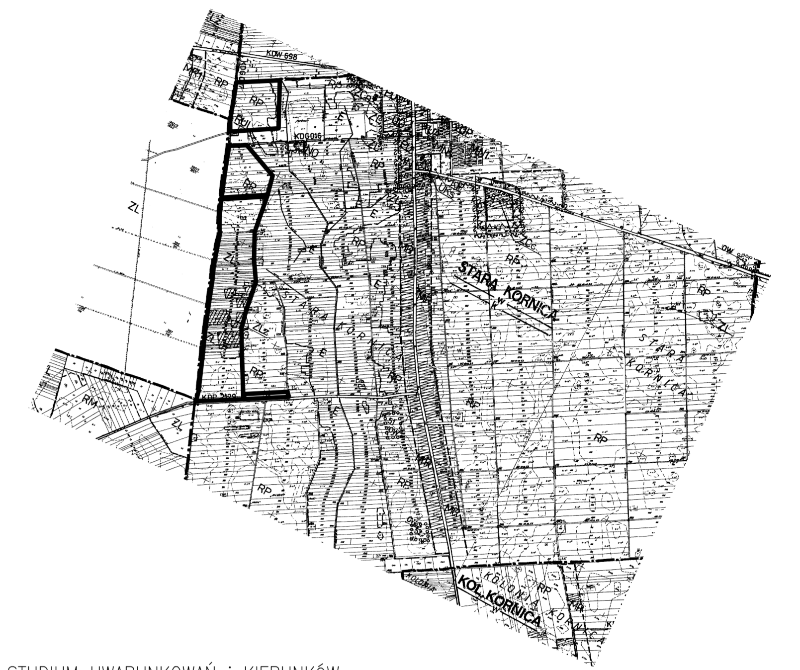
WYRYS ze STUDIUM UWARUNKOWAŃ I KIERUNKÓW ZAGOSPODAROWANIA PRZESTRZENNEGO GMINY STARA KORNICA skala 1:10000

RYСУNEK PLANU Załącznik nr 1 Rysunek nr 1 do uchwały Nr XVII/106/2012 Rady Gminy Stara Kornica z dnia 5 czerwca 2012 r.