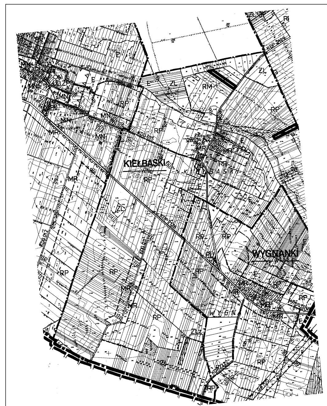
WYRYS ze STUDIUM UWARUNKOWAŃ i KIERUNKÓW ZAGOSPODAROWANIA PRZESTRZENNEGO GMINY STARA KORNICA skala 1:10000

Mapa ewidencyjna skala 1:5000 w. Kornica St. Kornica Kielbaski